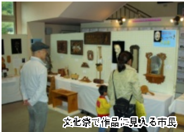
文化祭で作品を見入る市民

入間市では現在、1100団体、1万人以上の方が公民館で活動しています。近隣市に比べて活発な公民館活動であり、誇るべきものです。これは入間市が社会教育活動を重視し、生涯教育を保障してきた成果です。