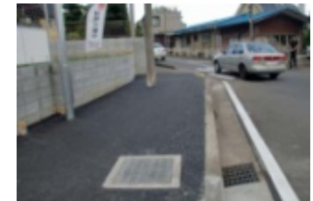
安川新道と国道の交差点・歩道が整備

道路際の土地が宅地開発されるのに伴い、私は、東町後援会のみなさんと一緒に「歩道の拡幅」を市に要望しまし