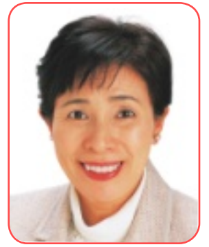
日本共産党市議会議員

みなさん、こんにちは。梅雨もあけ、いよいよ夏本番です。この夏、消費税引き上げ問題が急浮上。その前に、税金のムダ遣いこそ見直すべきではないでしょうか。