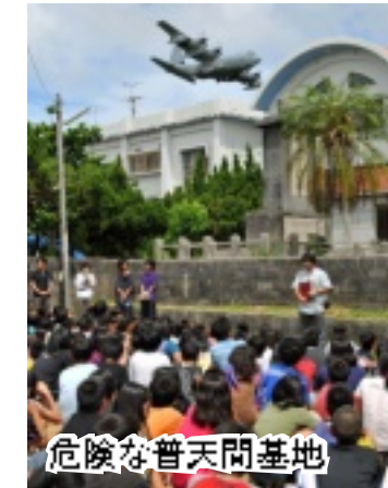
危険な普天間基地

普天間基地の辺野古移設に反対と怒りの世論が広がっています。解決の道は基地の無条件撤去しかありません。