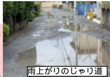
雨上がりのじゃり道

じゃりを繰り返すひいたため、宅地の方が低くなっています。改善を求めると、「現地を本格的に調査し、雨水、排水の対策も含めて実施する」と、改善に向け努力する姿勢を示しました。